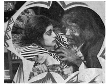
1920 LA TÊTE DE JANUS (Der Januskopf) de F. W. Murnau avec Margarethe Kupfer