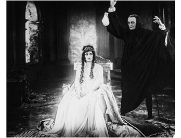
1922 LUCRÈCE BORGIA (Lucrezia Borgia) de Richard Oswald avec Liane Haid