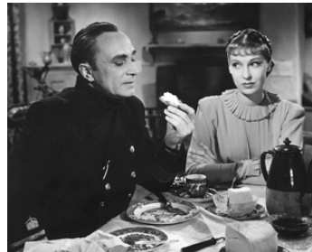
1939 L'ESPION NOIR (The Spy in Black) de Michael Powell avec June Duprez