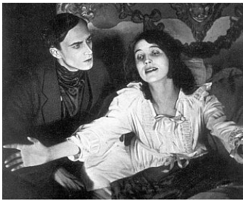
1918 LE JOURNAL D'UNE FILLE PERDUE de Richard Oswald avec Erna Morena