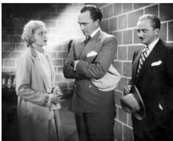
1930 VELETES (Die große Sehnsucht) de Steve Sekely avec Camilla Horn, Theodor Loos