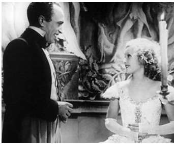
1932 MOI ET L'IMPÉRATRICE (Ich und die Kaiserin) de F. Hollander avec Lilian Harvey