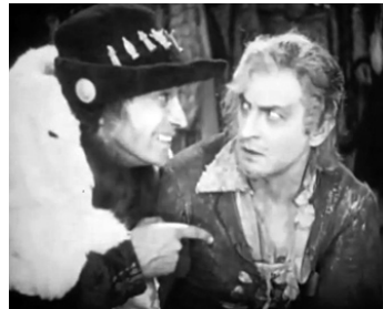
1926 LE VAGABOND BIEN-AIMÉ (The beloved Rogue) d'A. Crosland avec Constance Talmadge