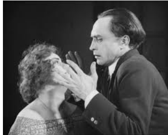
1923 LES MAINS D'ORLAC (Orlacs Hände) de Robert Wiene avec Alexandra Sorina