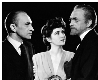
1942 NAZI AGENT (Salute to courage) de Jules Dassin avec Frank Reicher