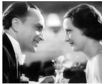
1933 I.F.I NE RÉPOND PLUS (F.P.I) de Karl Hartl avec Jill Esmond