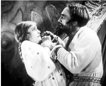
1922 LE CABINET DES FIGURES DE CIRE (Das Wachsfiguren Kabinett) de Paul Leni