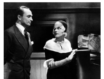
1932 ROME-EXPRESS (Rome Express) de Walter Forde avec Esther Ralston