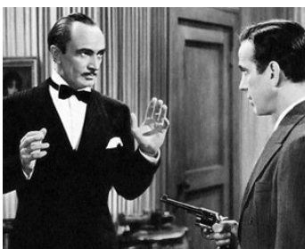
1942 ÉCHEC À LA GESTAPO (All through the Night) de Vincent Sherman avec Humphrey Bogart