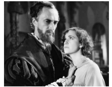
1933 LE JUIF ERRANT (The Wandering Jew) de Maurice Elvey avec Peggy Ashcroft