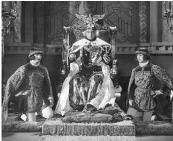
1926 HENRI IV (Enrico IV, die Flucht in die Nacht) d'Amleto Palmieri