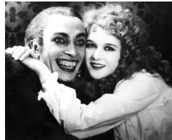
1928 L'HOMME QUI RIT (The Man who laughs) de Paul Leni avec Mary Philbin