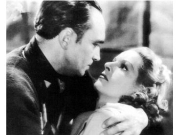
1938 TEMPÊTE SUR L'ASIE de Richard Oswald avec Madeleine Robinson