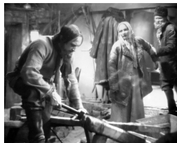
1930 RASPOUTINE (Rasputin, Dämon der Frauen) d'Adolf Trotz avec Charlotte Ander