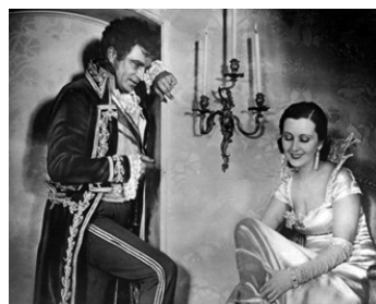
1931 LE CONGRÈS S'AMUSE (Der Kongreß tanzt) d'Erik Charell avec Lilian Harvey