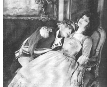
1921 LADY HAMILTON (Lady Hamilton) de Richard Oswald avec Liane Haid