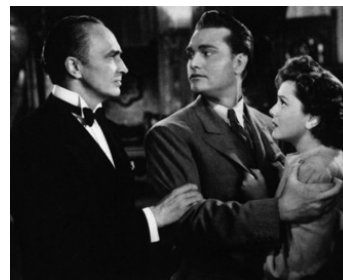
1941 ALERTE SUR LES ONDES (Whistling in the Dark) de S. Simon avec R. Skelton, A. Rutherford