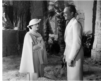
1934 BELLA DONNA (Bella Donna) de Robert Milton avec Mary Ellis