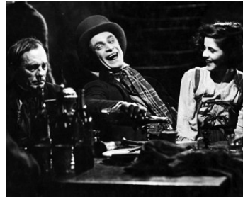
1926 L'ÉTUDIANT DE PRAGUE (Der Student von Prag) d'Henrik Galeen avec M. Maximilan, Elizza La Porta