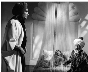
1940 LE VOLEUR DE BAGDAD (The Thief of Bagdad) de M. Powell avec June Duprez