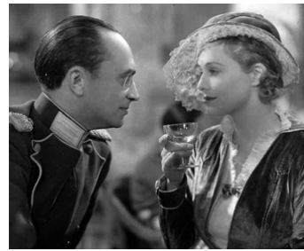
1933 J'ÉTAIS UNE ESPIONNE (I was a Spy) de Victor Saville avec Madeleine Carroll