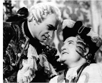
1934 LE JUIF SÜSS (Jew Suess) de Lothar Mendes avec Frank Vosper