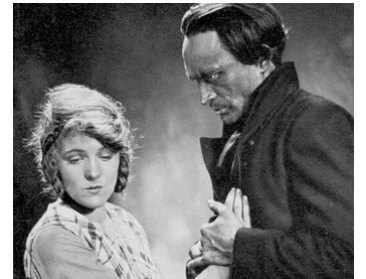
1929 LA DERNIÈRE COMPAGNIE (Die letzte Kompanie) de Kurt Bernhardt avec Karin Evans