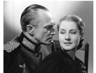
1940 ÉVASION (Escape) de Mervyn LeRoy avec Norma Shearer