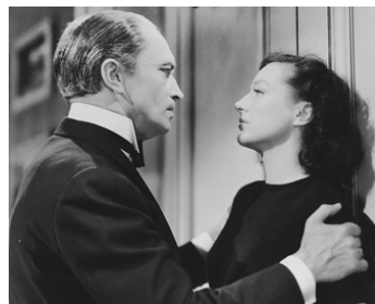
1940 IL ÉTAIT UNE FOIS (A Woman's Face) de George Cukor avec Joan Crawford