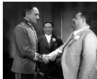
1930 L'HOMME QUI ASSASSINA de Kurt Bernhardt avec Gr. Chmarta, Heinrich George