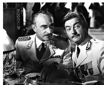
1942 CASABLANCA (Casablanca) de Michael Curtiz avec Claude Rains