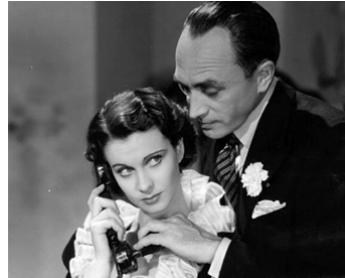
1936 L'ESPION DE LA SECTION 8 (Dark Journey) de Victor Saville avec Vivien Leigh