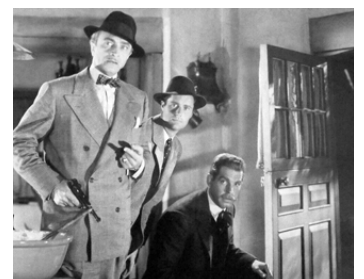
1943 UN ESPION A DISPARU (Above Suspicion) de R. Thorpe avec Bruce Lester, F. MacMurray