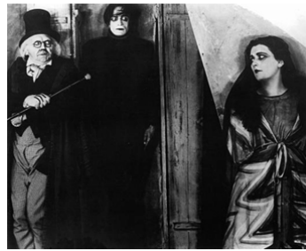
1919 LE CABINET DU Dr CALIGARI de Robert Wiene avec Werner Krauß, Lil Dagover