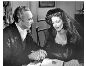
1941 LA ROSE BLANCHE (The Men in her Life) de Gregory Ratoff avec Loretta Young