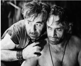
1935 LES DAMNÉS DE SANTA MARIA (King of the Damned) de Walter Forde avec Noah Beery