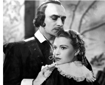
1937 SOUS LA ROBE ROUGE (Under the red Robe) de Victor Sjöström avec Annabella