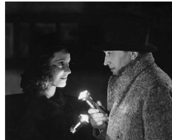
1939 ESPIONNE À BORD (Contraband) de Michael Powell avec Valerie Hobson