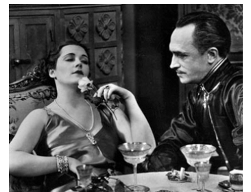
1931 LA NUIT DE LA DÉCISION de Dimitri Buchowetzki avec Olga Tschetchowa