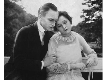
1926 LE VIOLONISTE DE FLORENCE (Der Geiger von Florenz) de Paul Czinner avec E. Bergner